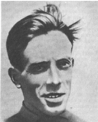
Alenas Žerbo 1989-1941.12.11.

Šį rudenį sukanka aštuoniasdešimt metų, kai iki tol niekam nežinomas trisdešimtmetis prancūzas ALENAS ŽERBO (Alain Gerbault), su nedideliu burlaiviu perplaukęs Atlanto vandenyną, staiga tapo jūreivystės didvyriu (plaukimo datos 1923.07.06-1923.09.15). Jis ir šiandien vis dar laikomas vienu žymiausių jūrų keliautoju-vienutininku, išgarsinusių buriavimo sportą. Kodėl šis "jūrų robinzonas" nusipelnė tokios šlovės? Juk jis nebuvo nei pirmas, nei paskutinis jūreivystės diletantas, kuris metė iššūkį Pasauliniam vandenynui ir įveikė jį. Pastaruoju metu apie tai diskutuojama ne vienoje užsienio spaudoje pasirodžiusioje publikacijoje, kuriomis remiantis ir parengtas šis rašinys.